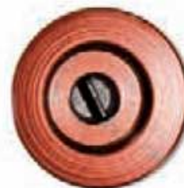
350D19C Aluminio, Cobre.