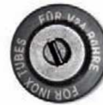
350D19S Acero inoxidable.