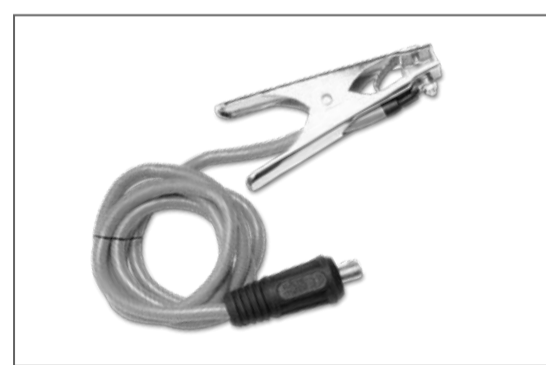
Conjunto de pinza de masa