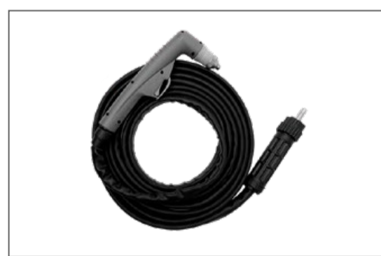
Antorcha Plasma TITAN HY X 100 (P1-X105*)